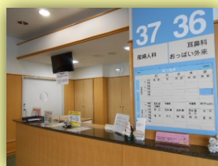
産婦人科外来 受付