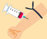
70 検体検査の待ち合い