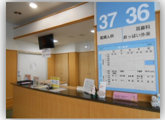
産婦人科外来 受付