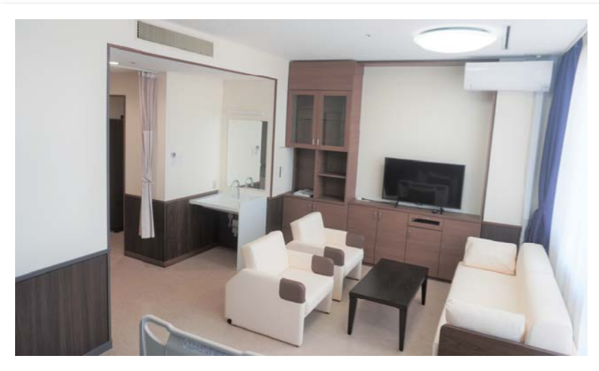
特別有料個室(洋室)