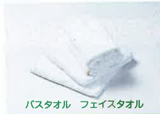
バスタオル フェイスタオル