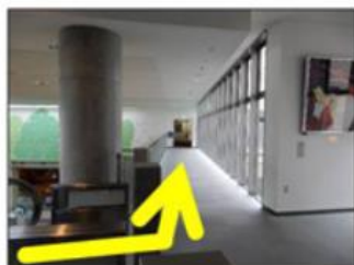
エスカレーターを上がり左へ