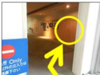
渡り廊下の先のすぐ右が会場